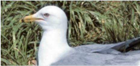
Goéland à bec cerclé ( Larus delawarensis ) Bec jaune Anneau noir Pattes jaunes ou verdâtres

Originaire de l'Ouest du Canada, le Goéland à bec cerclé venait rarement nous visiter au début du siècle. Dans les années 1930, on l'observait fréquemment dans la région montréalaise. Mais, ce n'est qu'en 1953 qu'un premier nid fut découvert à Montréal. Depuis, l'espèce s'est graduellement propagée vers l'est, le long du Saint-Laurent, et a atteint la région de Québec dans les années 1970. Aujourd'hui, la population de Goéland à bec cerclé se maintient autour de 100 000 couples au Québec.